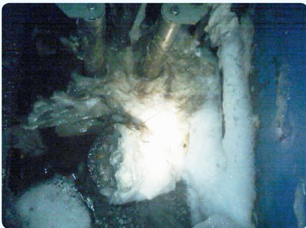
Durch Feuchttücher verstopfte Pumpe Pump clogged by wipes